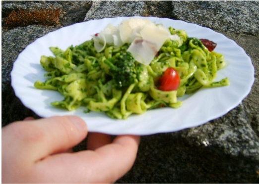
Tagliatelle mit Pesto Genovese oder Rosso