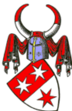
Graf von Erbach