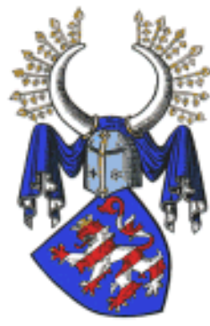
Landgraf von Hessen