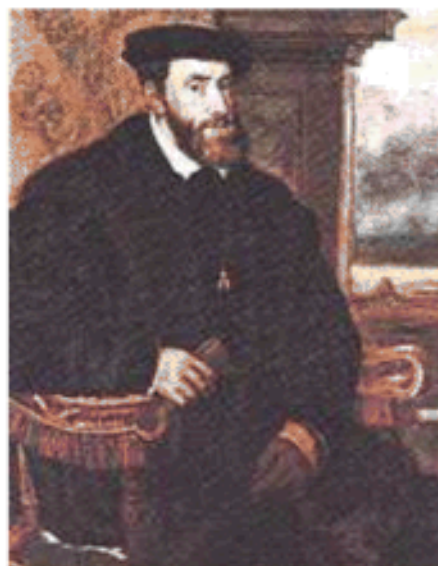
Kaiser Karl V. (* 24.2.1500, † 21.9.1558), Sohn des Habsburgers Philipp des Schönen von Österreich